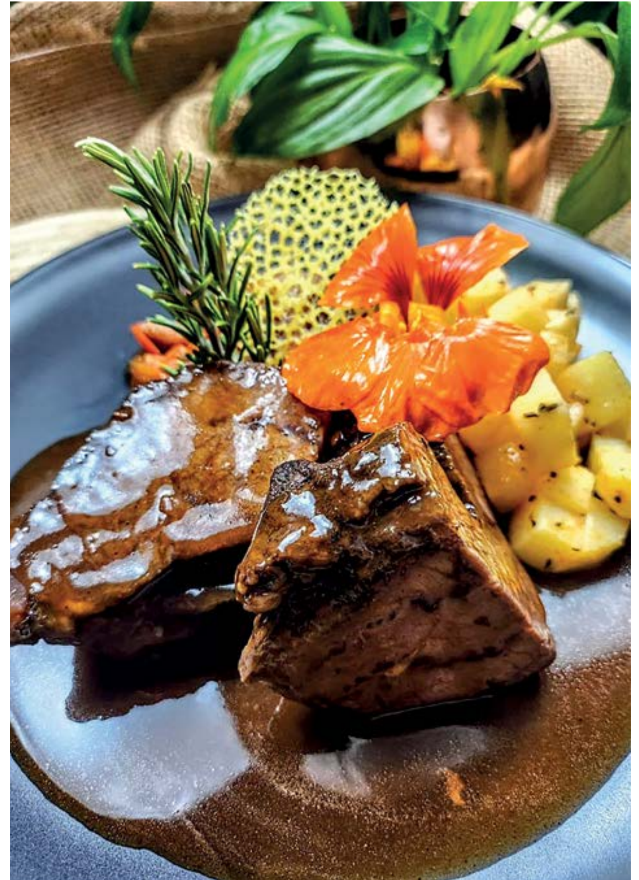
Küchenkreation mit Rinderbäckchen und Rosmarinkartoffeln