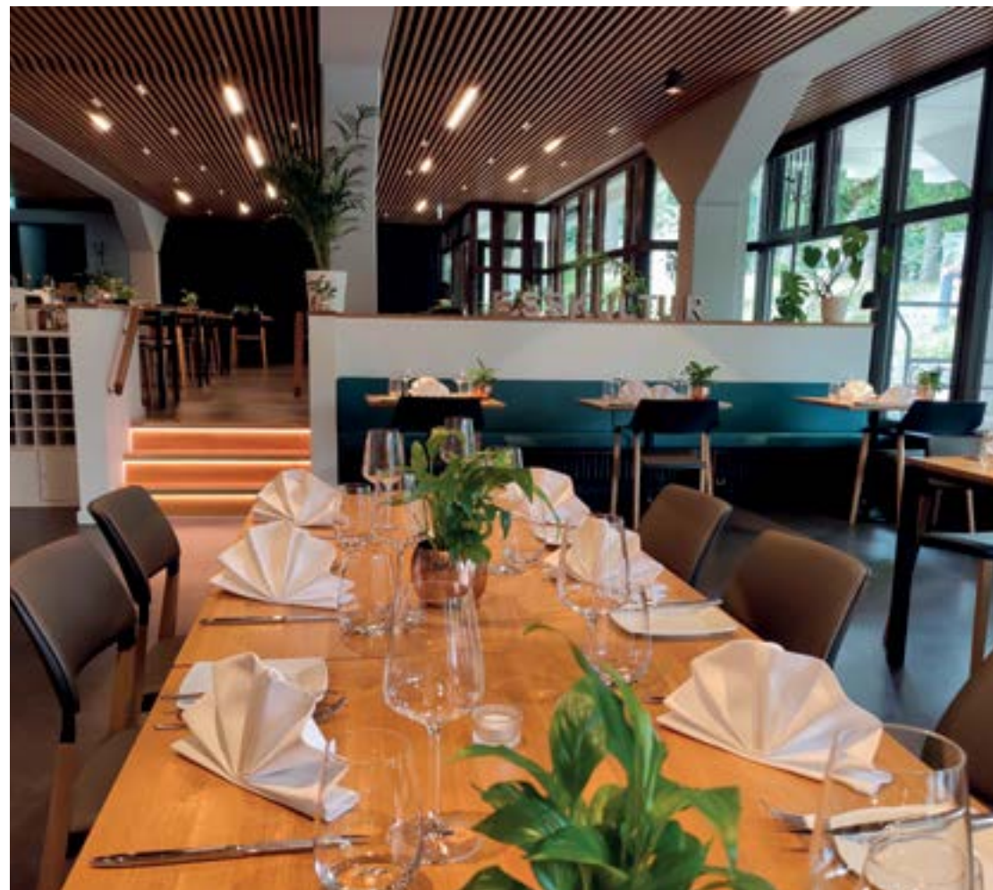
Das Bürgerhaus ist eingebettet in den Blankenhompark mitten in Müllheim