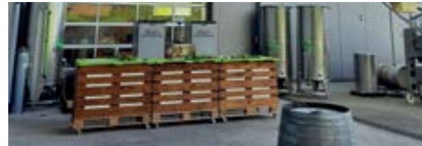
Weingut Büchin als Eventlocation mit besonderem Flair