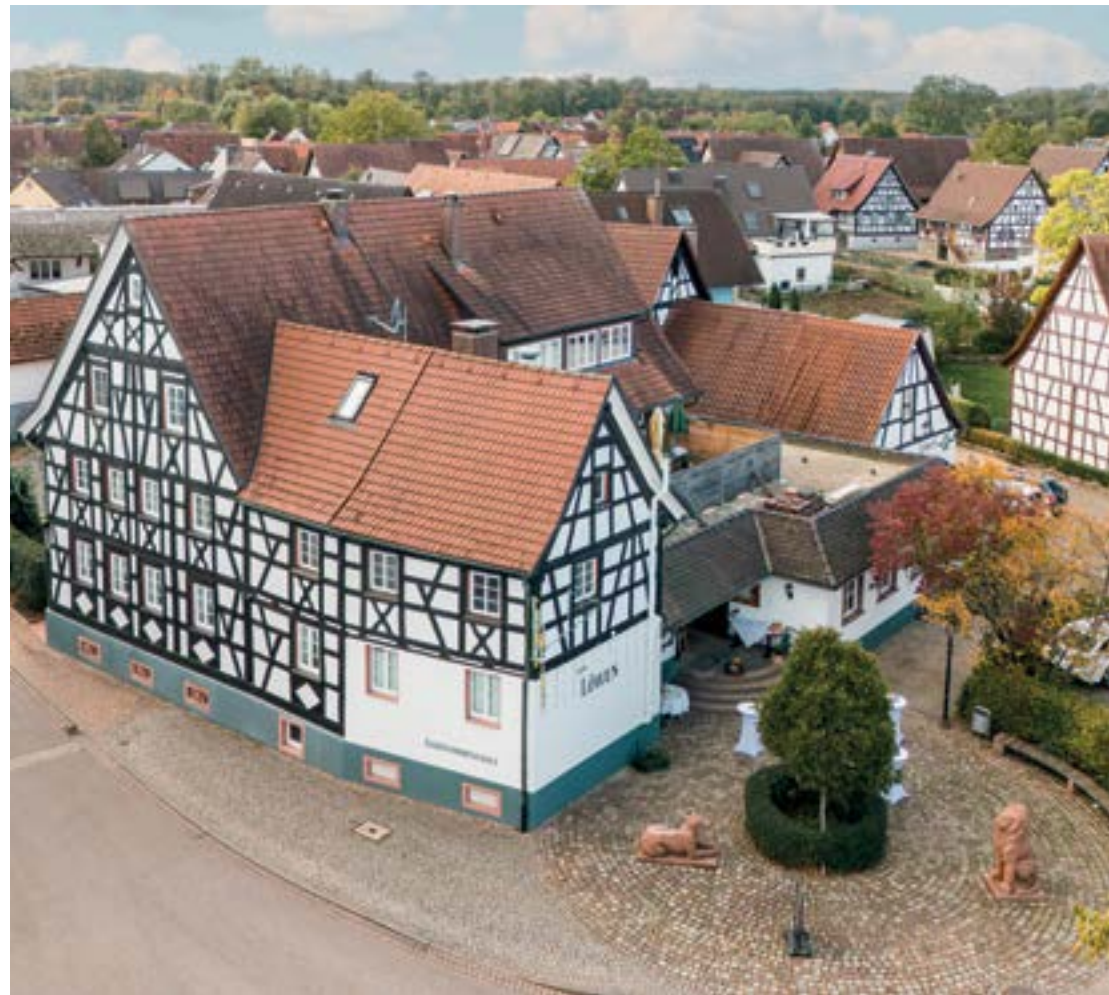
Das Gasthaus Zum Löwen im Herzen des Fachwerkkortes Vörsstetten