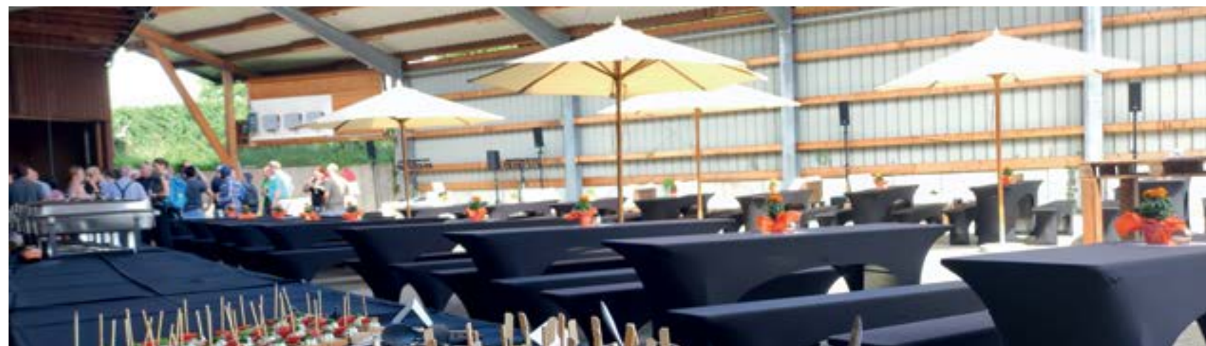
Catering bei einem Sommerfest auf einem Firmengelände außer Haus.

Der Löwen überzeugt mit urigem Charme, in besonderer Atmosphäre. Eingebettet in das verträumte Fachwerkdorf, sticht das schmuckvolle Haus ins Auge. Liebevollen Details geben jedem Raum einen einzigartigen Charakter. Der direkt angrenzende Garten befindet sich im Hinterhof und wird durch Glyzinien natürlich beschattet zur Kulisse für schöne Momente.