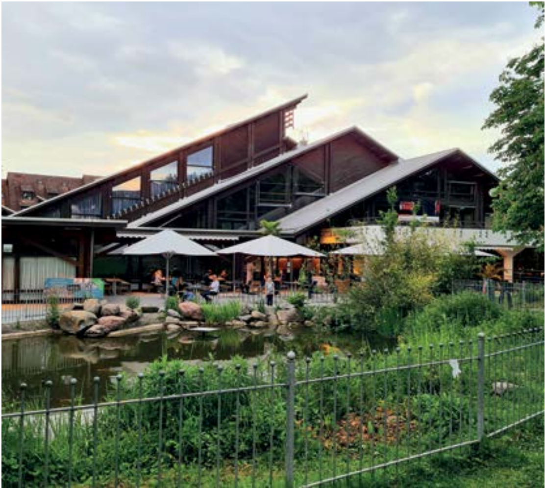
Das Bürgerhaus ist eingebettet in den Blankenhornpark mitten in Müllheim