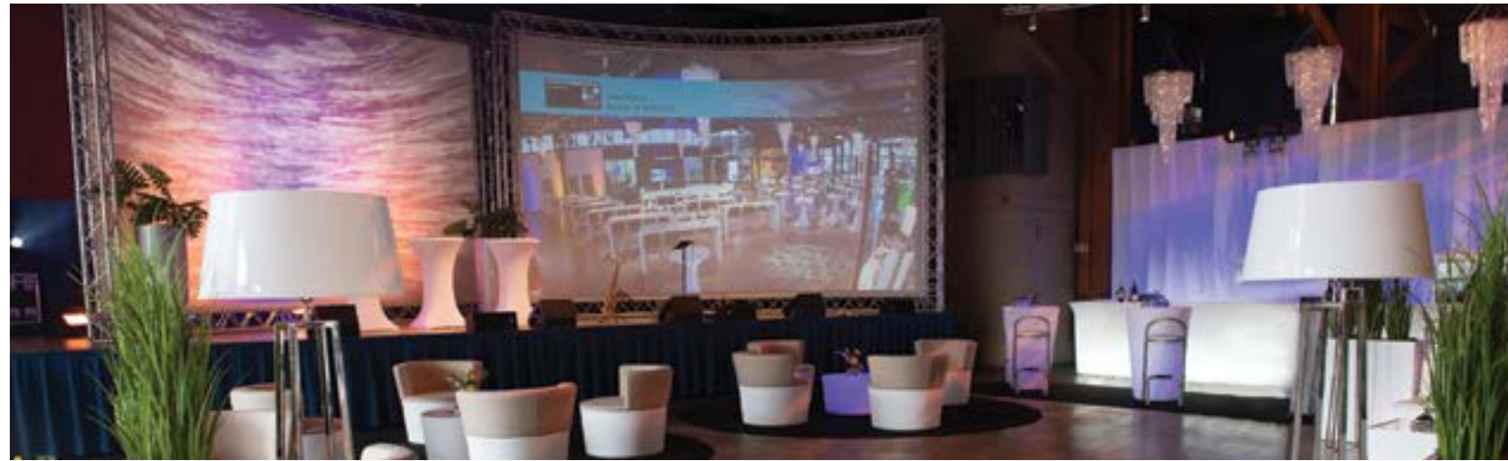
Großer Saal im Bürgerhaus mit Loungemöbeln zum B2B-Event