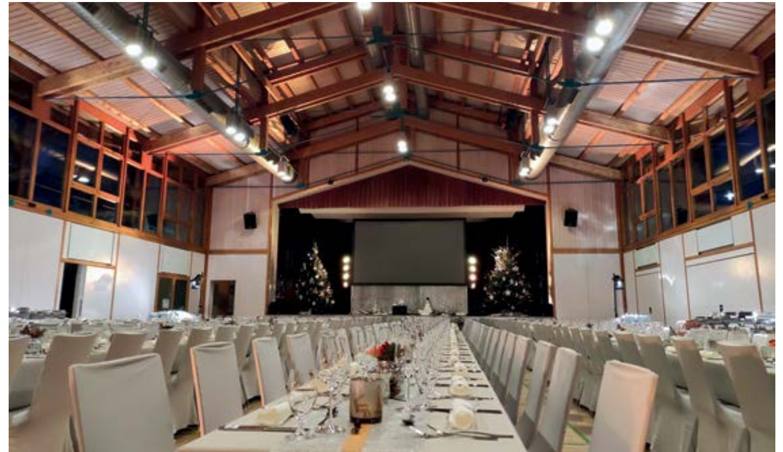
Weihnachtsfeier in der Castellberghalle Ballrechten-Dottingen