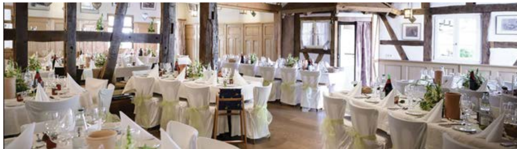
Die Scheune im Löwen Vörsstetten mit rustikalem Ambiente

Das Bürgerhaus Müllheim liegt im schönen Blankenhornpark mitten in Müllheim, so dass Sie Ihre Gäste auf der Dachterrasse oder dem weitläufigen Außengelände im Grünen empfangen können. Hier befindet sich auch unser Restaurnat EssKultur mit der Sonnenterrasse, die im Sommer zu gemütlichem Besiammen-sein bei gutem Essen und hervorragendem Service einlädt.