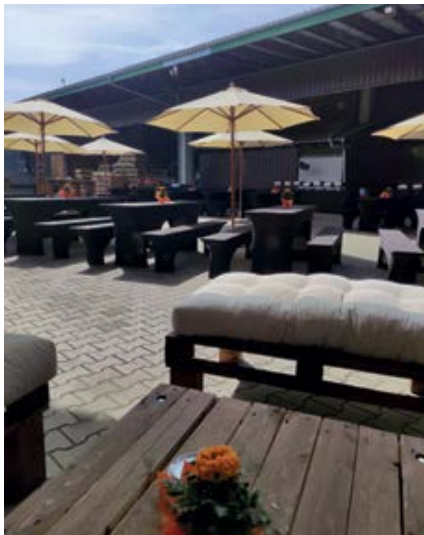
Sommerevent mit Barbecue

Als fester Catering-Partner auf Schloss Bürgeln richten wir regelmäßig Veranstaltungen im Garten und im Gleichensteinsaal aus. Aber auch Veranstaltungen wie z.B. auf dem Weingut Büchin, oder Weingut Schneider-Krafft, am Schlossberg in Freiburg, in der Castellberghalle Ballrechten-Dottingen, Sonnenberghalle Auggen, verschiedenen Firmengeländen u.v.m durften wir in der Vergangenheit begleiten.