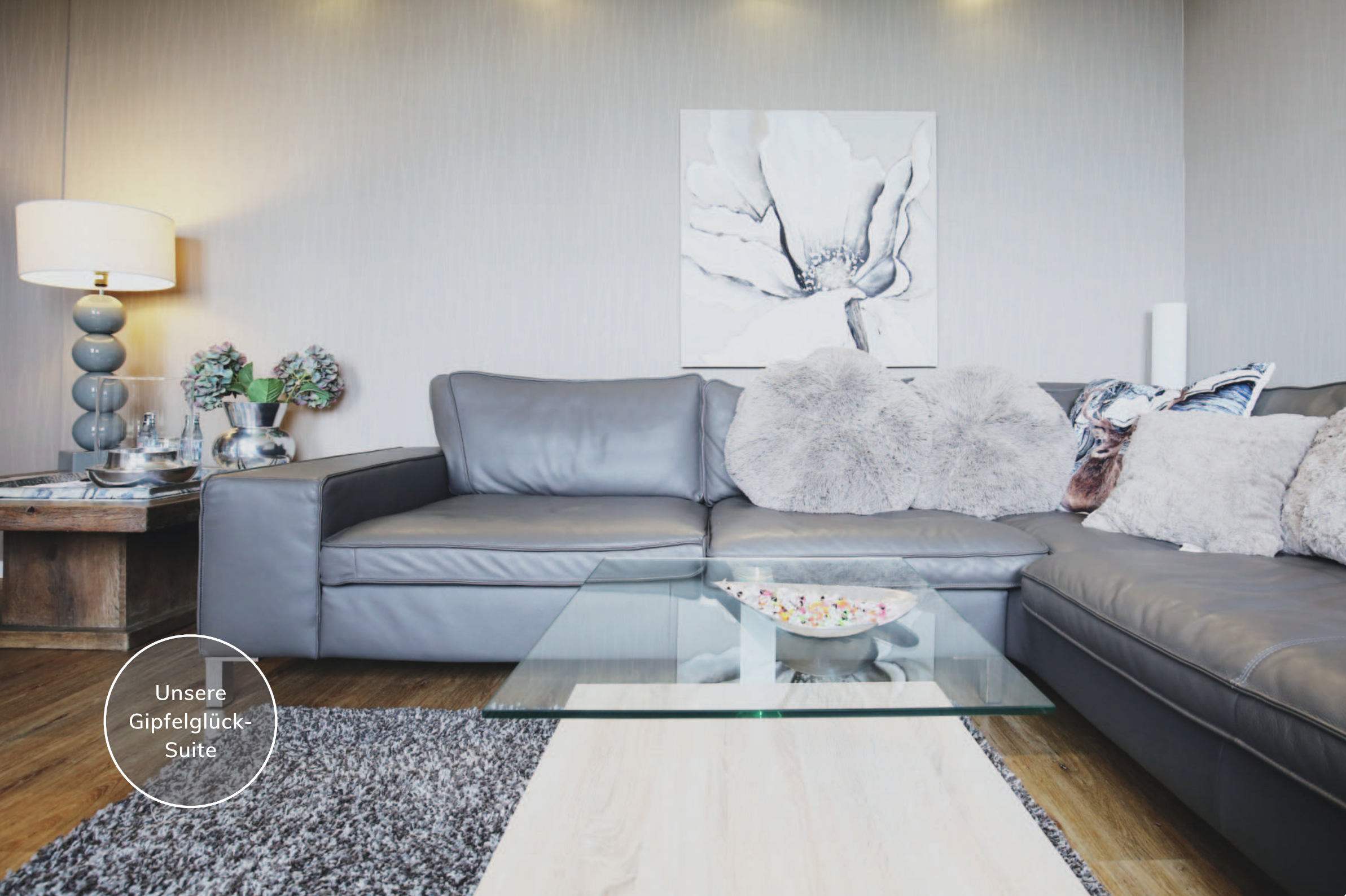
Unsere Gipfelglück- Suite