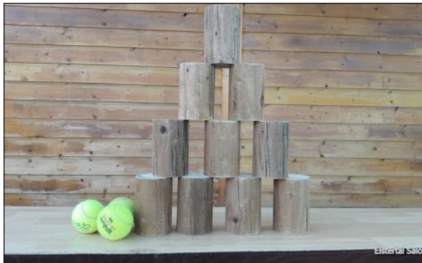
Baumstamm-Zielwurf (Holz statt Blechbüchsen)