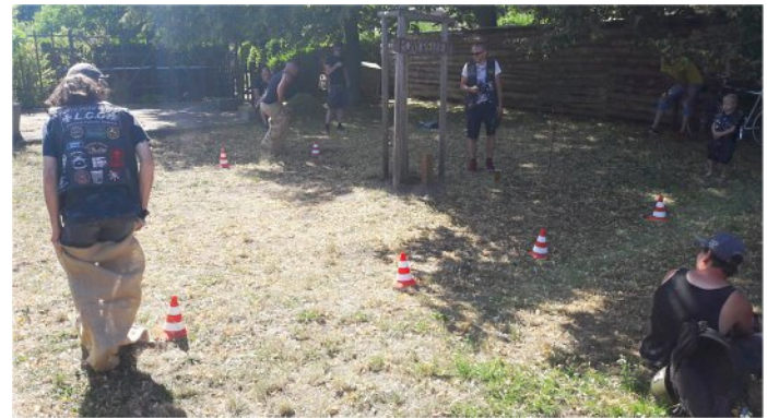
Sackhüpfen für Groß & Klein