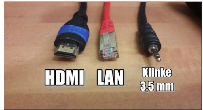
Anschlüsse für Beamer, LAN-Internet und Laptop