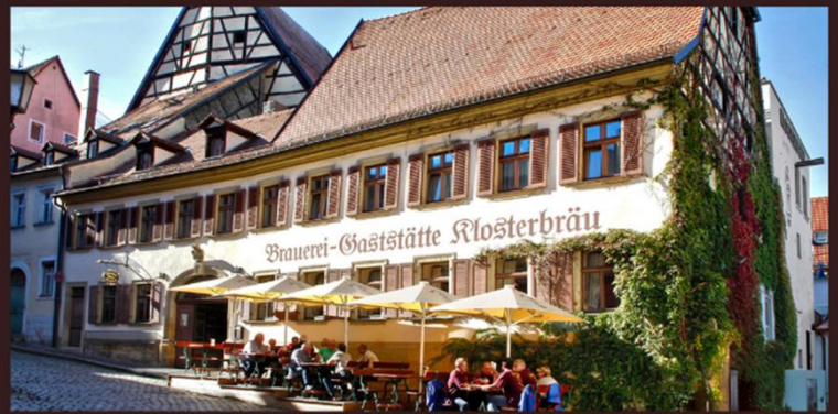
Außenansicht Terrassenstufen vor dem Gebäude, Biergarten rechts am Gebäude (hier nicht sichtbar, s.u.)