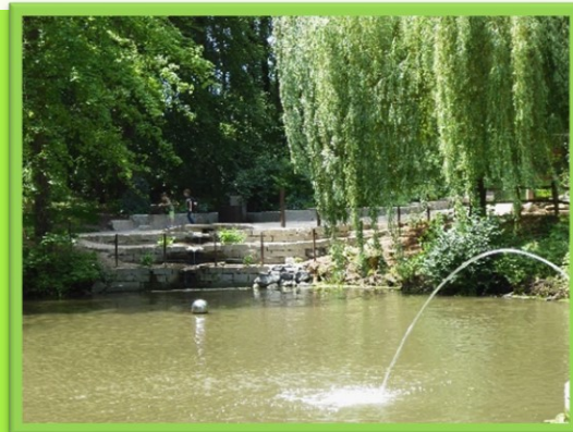
Station "Schwester Wasser"