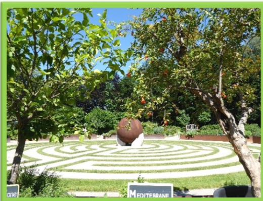
Station "Mutter Erde"

Am Kloster führt der Oberschwäbische Pilgerweg vorbei sowie der Martinusweg zwischen den zwei Martinuskirchen Tannheim und Erolzheim.